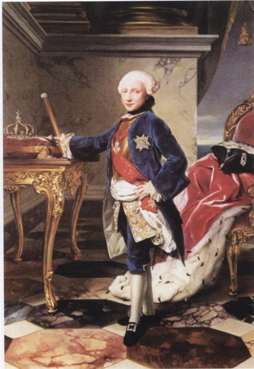
Abb. F 2: Anton Raphael Mengs, Bildnis König Ferdinand IV. von Neapel im Alter von neun Jahren , 1759/1760.