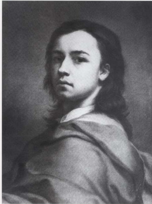
Abb. SW 1: Anton Raphael Mengs, Selbstbildnis in Pastell , 1744.