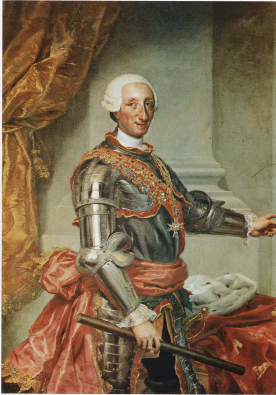
Abb. F 4: Anton Raphael Mengs, Bildnis König Karl III. von Spanien , um 1767.