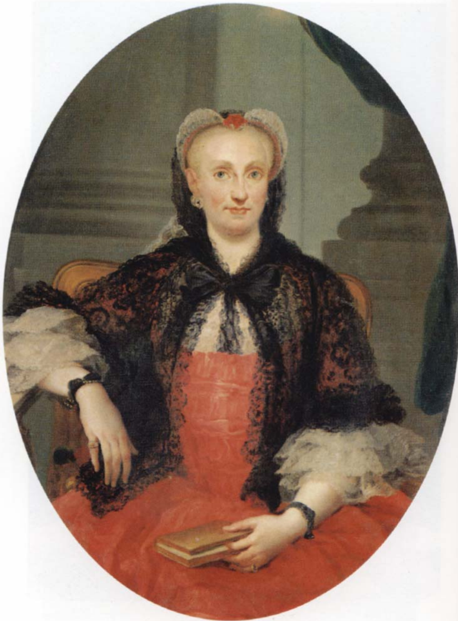
Abb. F 3: Anton Raphael Mengs, Bildnis Königin Maria Amalia von Spanien , nach 1761.