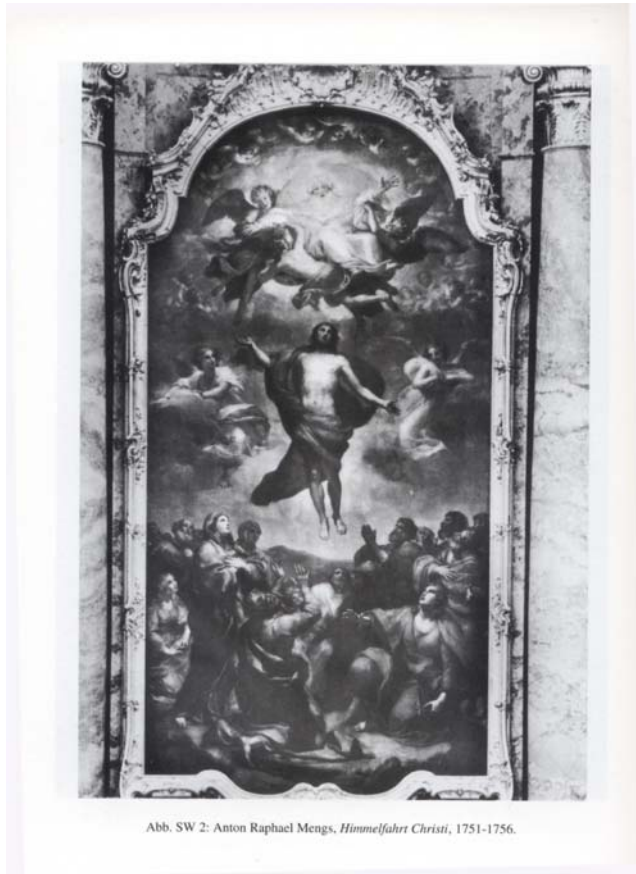
Abb. SW 2: Anton Raphael Mengs, Himmelfahrt Christi , 1751-1756.