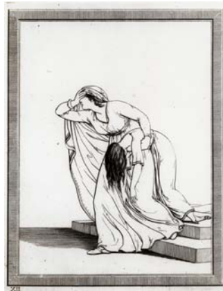
Abb. 1: Emma Hamilton als Niobe

zum Grundstock der späteren Attitudes beitrug. 4 In Italien wird sie dann von Angelika Kauffmann und Johann Heinrich Wilhelm Tischbein gemalt, dessen Iphigenie-Darstellung wiederum von Goethes Lesungen aus seinem Drama angeregt ist; 5 etwas später gesellen sich noch Élisabeth-Louise Vigée-Lebrun und Thomas Lawrence zu den Porträtisten. So werden aus den 'beweglichen Statuen' wieder gemalte Bilder, so daß es nicht zuviel gesagt ist, daß Emma 'denn überhaupt als Typus für alle Heroinen, Musen und Halbgöttinnen gelten mußte' (FA I, 15.1, S. 408). Die Summe dieses Prozesses bilden die 1794 erschienenen klassizistischen Umrißzeichnungen ihrer Attitudes von Friedrich Rehberg, die freilich nur einen kleinen Ausschnitt aus Emmas immensem Repertoire bieten (Abb. 1 und 2).