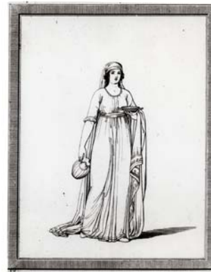
Abb. 2: Emma Hamilton als Priesterin